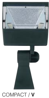
COMPACT / V